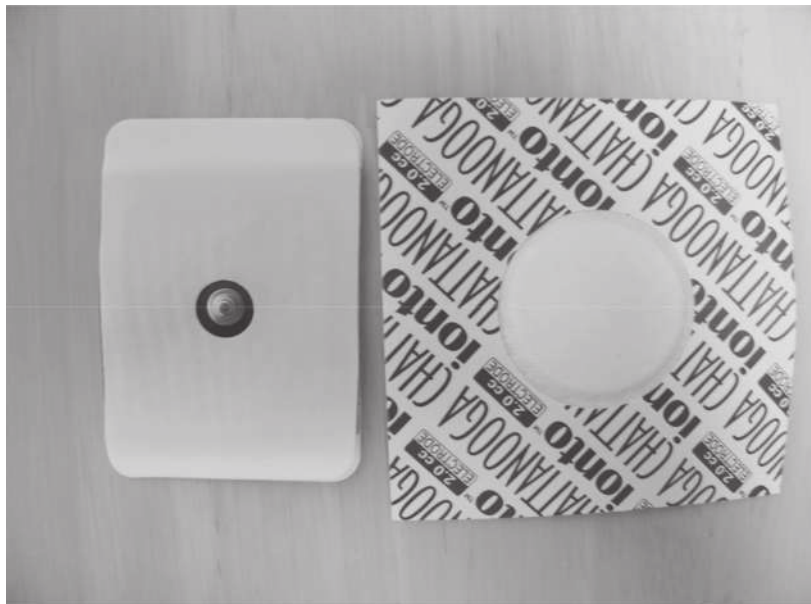
図 2 イオントフォーシス専用電極 (Chattanooga 社製 OptimA Disposable Electrode)

右が輸送電極、左が分散電極である。輸送電極の中央は綿状で、ここに薬剤を塗布する。分散電極には、IP に伴う副作用を軽減するための緩衝剤が含有されている。